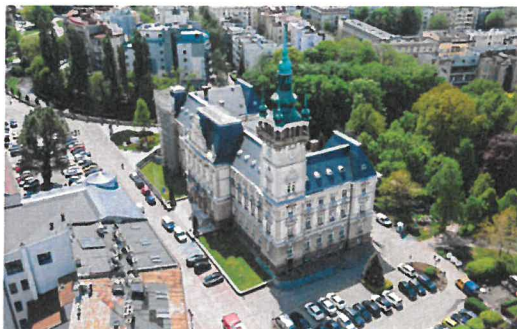
Ratusz w Bielsku-Białej

Prezydent Miasta Bielska-Białej zarządził konsultacje społeczne projektu uchwały w sprawie wyznaczenia obszaru zdegradowanego i obszaru rewitalizacji na terenie miasta Bielska-Białej oraz projektu uchwały w sprawie określenia zasad wyznaczenia składu oraz zasad działania Komitetu Rewitalizacji Miasta Bielska-Białej. Konsultacje swoim zasięgiem obejmują obszar miasta Bielska-Białej.