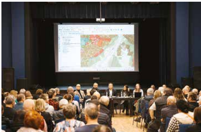
Zdjęcia ze spotkań konsultacyjnych w Bielsku-Białej