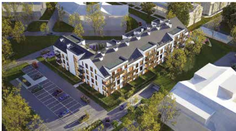
Na str. 1 i powyżej wizualizacje Biura Projektowego 4ideA