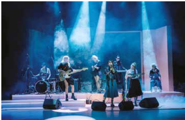
Służące do wszystkiego

Kandydatami do maski w tej kategorii w tym roku są spektakle: Chłopcacy w reżyserii Krzysztofa Zyguckiego w Teatrze Śląskim im. St. Wyspiańskiego w Katowicach; Jeśli przecięto cię na pół w reżyserii Kaliny Jagody Dębskiej w Teatrze im. Adama Mickiewicza w Częstochowie oraz Drakula w reżyserii Jakuba Roszkowskiego w Teatrze Miejskim w Gliwicach. mt