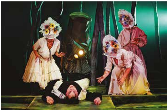
Scena ze spektaklu Kwiat paproci