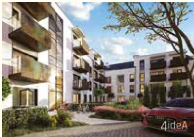
Wizualizacje powstającego budynku, obok – spotkanie przy podpisywaniu umowy