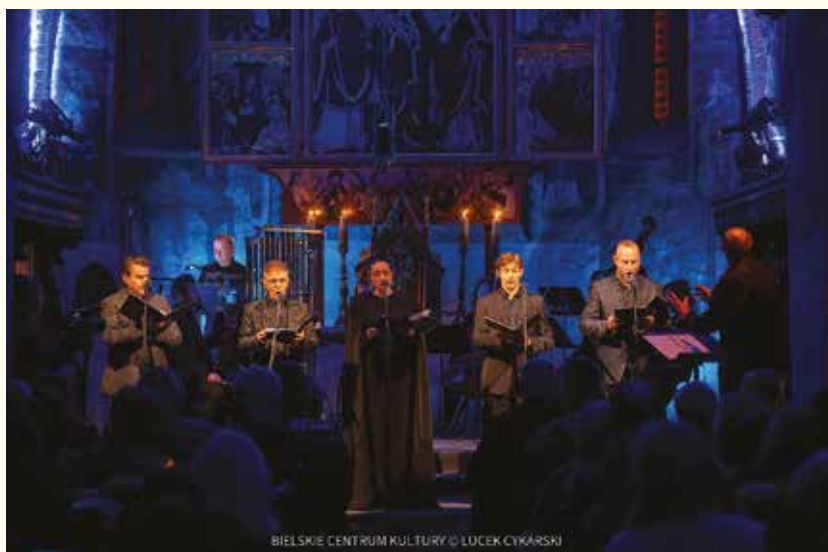
BIELSKIE CENTRUM KULTURY © LUCEK CYKARSKI