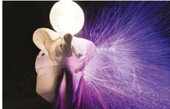
Plenerowy spektakl Sen Herberta

W maju w Bielsku-Białej wielkie teatralne wydarzenie – 31. Międzynarodowy Festiwal Sztuki Lalkarskiej. Swoje spektakle pokażą zespoły z Francji, Norwegii, Stanów Zjednoczonych, Japonii, Belgii, Holandii, Niemiec, Wielkiej Brytanii, Szwajcarii, Izraela, Słowenii, Litwy i Polski. Można już kupować bilety.