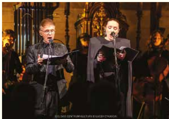
BIELSKIE CENTRUM KULTURY © LUCEK CYKARSKI