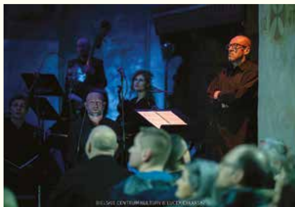
BIELSKIE CENTRUM KULTURY