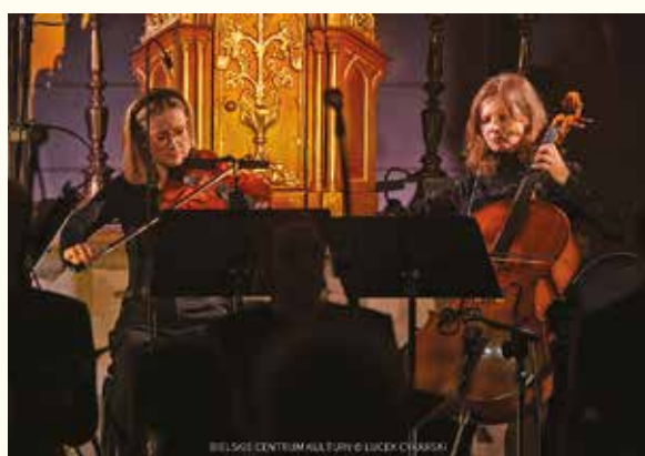
BIELSKIE CENTRUM KULTURY