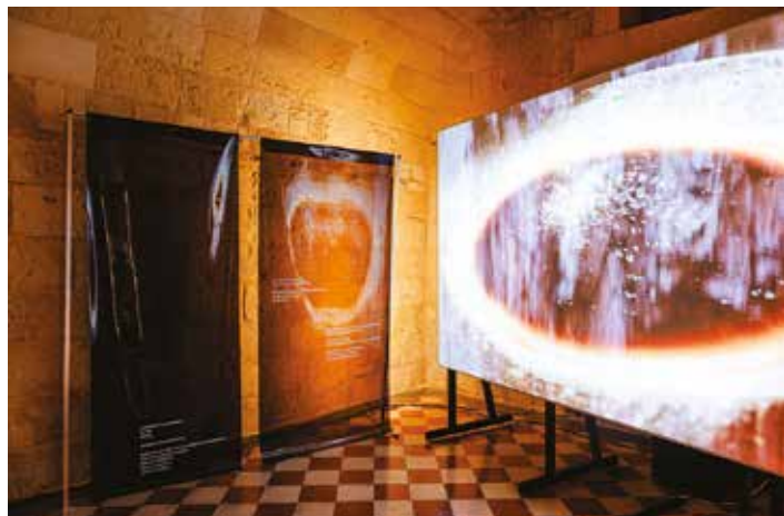
Instalacja Archiwum wahań