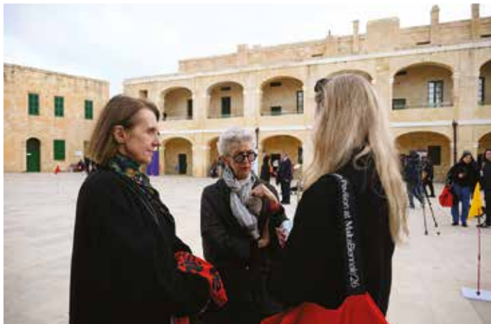
Goście na dziedzińcu Fortu św. Elma

go czytać inaczej, bo nie mają w pamięci pokoleniowych przemian. A jednocześnie uważamy, że praca ma wymiar uniwersalny.