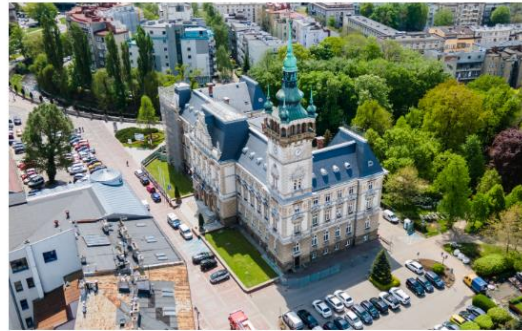
Ratusz w Bielsku-Białej

Prezydent Miasta Bielska-Białej zarządził konsultacje społeczne projektu uchwały w sprawie wyznaczenia obszaru zdegradowanego i obszaru rewitalizacji na terenie miasta Bielska-Białej oraz projektu uchwały w sprawie określenia zasad wyznaczenia składu oraz zasad działania Komitetu Rewitalizacji Miasta Bielska-Białej. Konsultacje swoim zasięgiem obejmują obszar miasta Bielska-Białej.